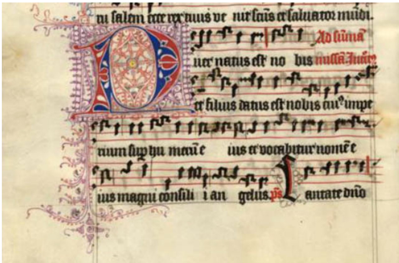
'Puer Natus': Intredegezing van de dagmis van Kerstmis uit het Graduale van het Amsterdamse Agnesklooster (begin 15de eeuw)

Tijdens de late middeleeuwen kende Amsterdam een rijke kloostertraditie en daarmee ook een rijke muzikale traditie. Van dat muzikale erfgoed zijn een viertal bronnen uit kloosters en twee boeken uit de Oude en Nieuwe Kerk bewaard gebleven, met daarin gregoriaanse gezangen. Het betreft zowel lijvige zangboeken voor kloosterzusters als ook handzame zangboekjes voor scholieren. Deze muziekhandschriften zijn nauwelijks bekend, maar bevatten fraaie muzikale verrassingen.